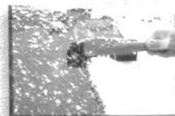
fegt Schnee vom Auto