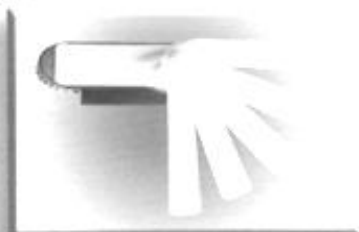
universell durch Drehgriff