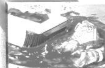
praktisch im Haushalt