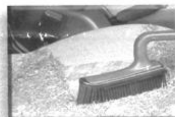
super auch im Auto