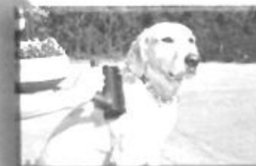
für Hunde und Katzen